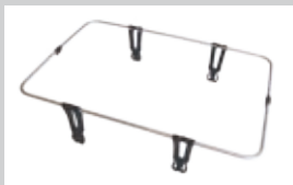
RELING Aufsteckreling zur Lade- flächenbegrenzung