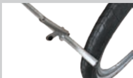
FESTSTELLBREMSE Die einfache Bremse wird mit dem Fuß betätigt und wirkt auf beide Laufräder