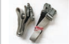
SPANNGURTE (2 Stück) zur Befestigung der Ladung