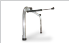
STÄNDER Doppelfußständer mit Gasdruckfeder