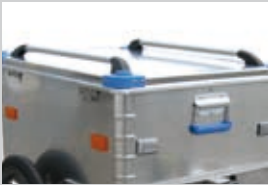
ALUBOX Hochwertige Alumi- niumbox regendicht mit Deckelreling. Befestigung mit Clips und Spanngurt (4x)