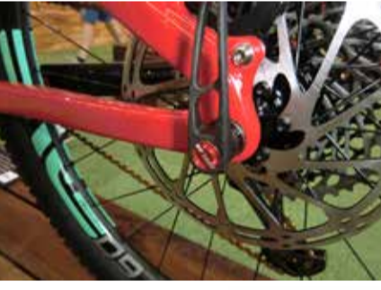
Steckachse zu Ausfallenden 3