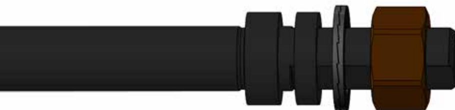
Steckachse zu Ausfallenden C