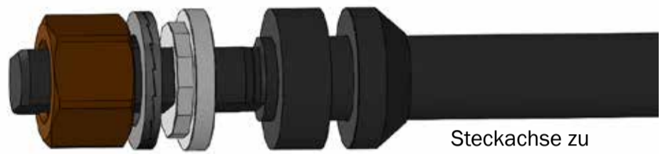
Steckachse zu Ausfallende 2