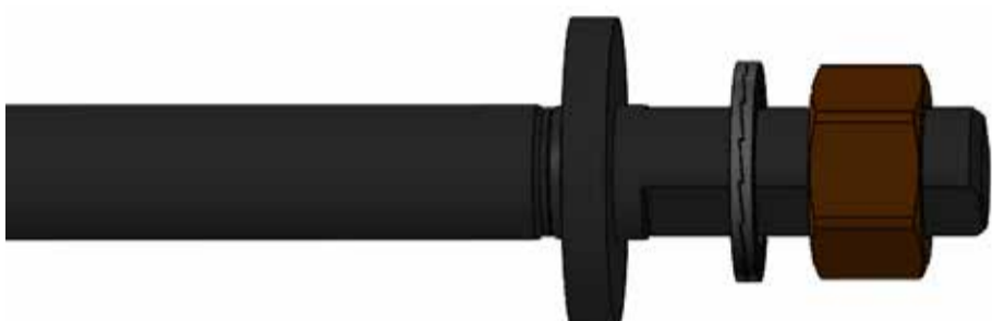
Steckachse zu Ausfallenden A