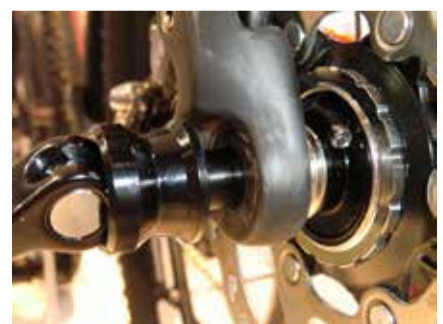
Steckachse zu Ausfallenden 4