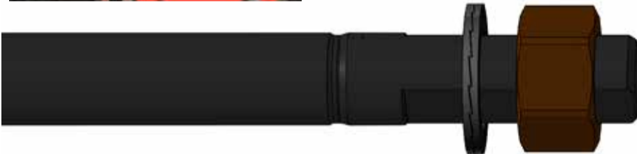
Steckachse zu Ausfallenden B