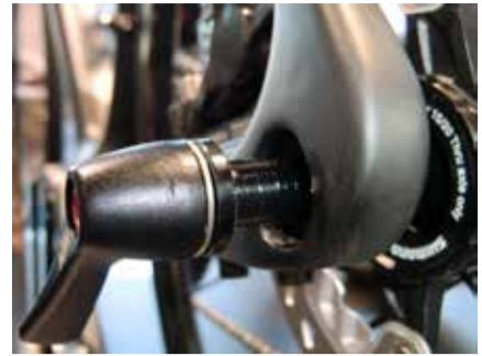
Steckachse zu Ausfallenden 1